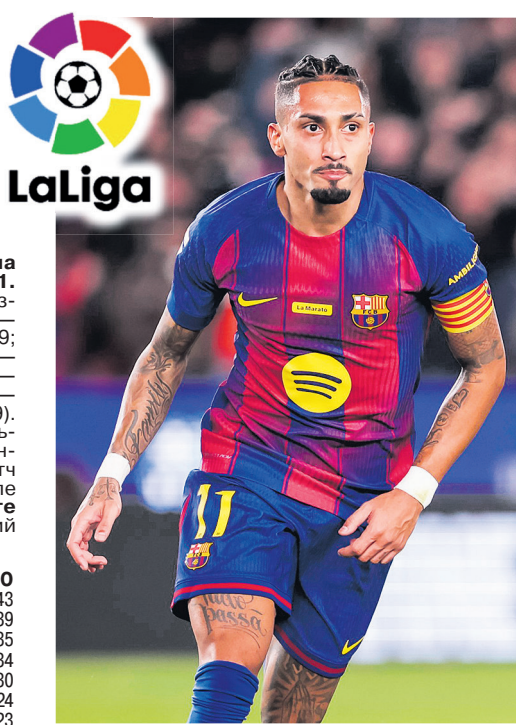
Эльче — Райо Вальекано, Бетис — Хетафе. 22.12. Атлетик — Эспаньол.

«Красные» выбрали оборонительную тактику, поставив у своей штрафной так называемый «автобус». Долгое время их план на игру работал — на табло горели нули. Однако в концовке победу каталонцам принес дубль Рафиньи.