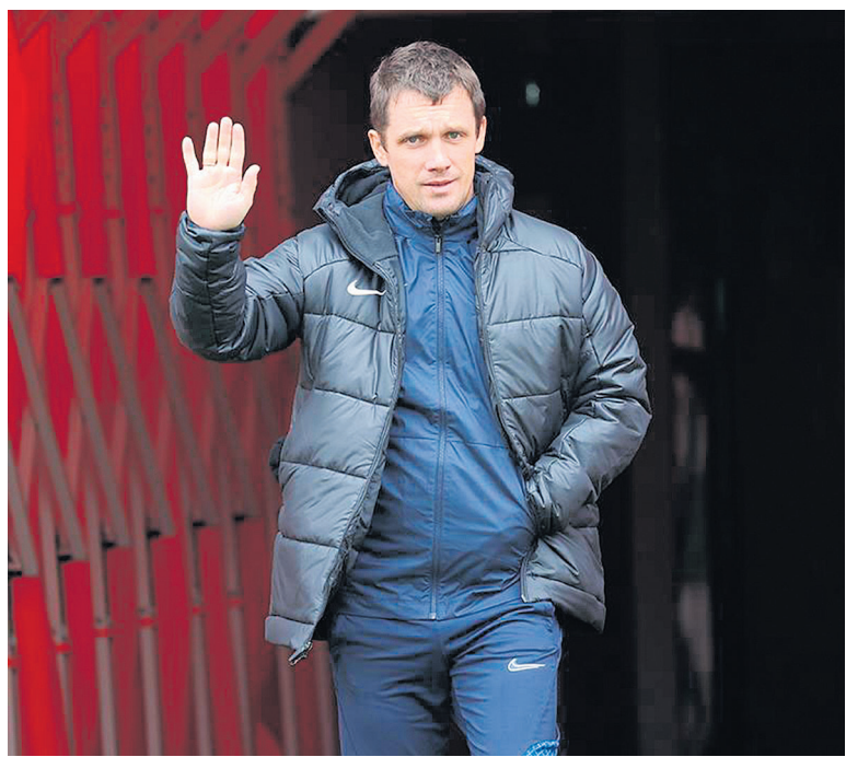
Фото ФФ «Ураг»